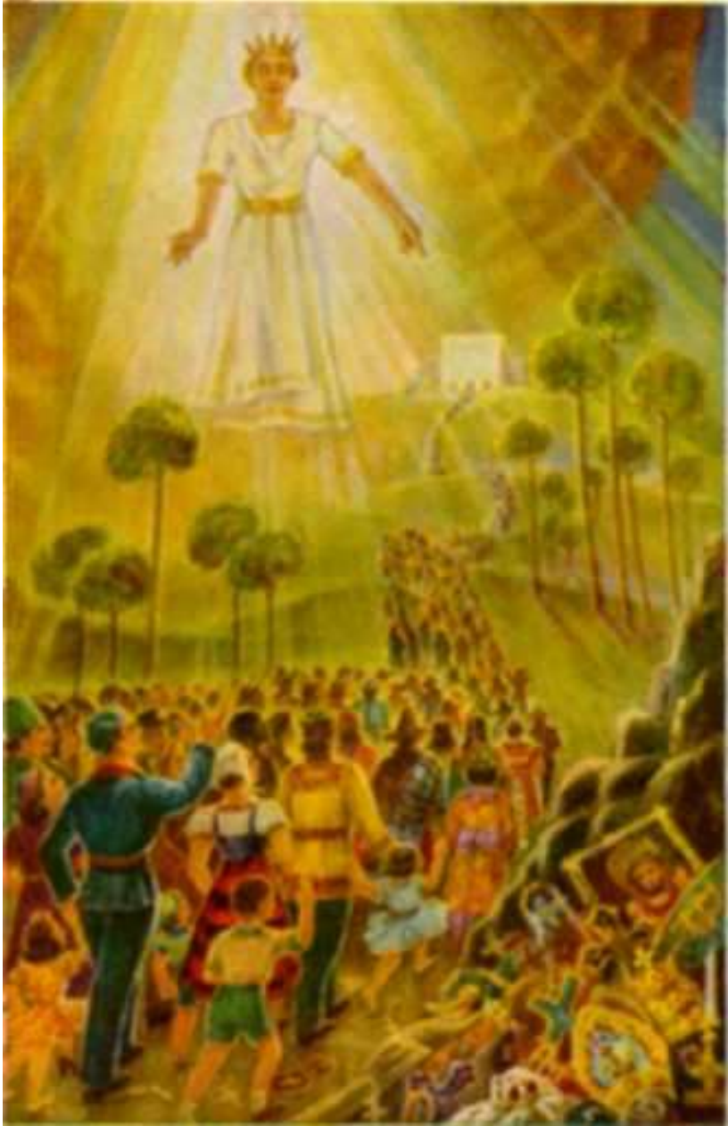
fleeing lo the Kingdom