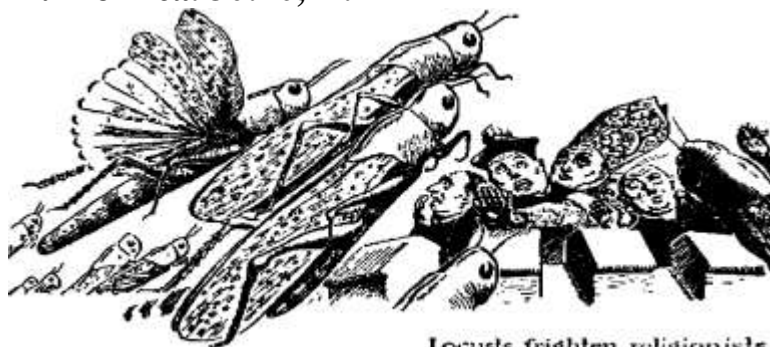
Locusts frighten religionists

Гієрархія і її союзники, які всі є ворогами царства Божого, прагнуть нарушити єдність і гармонійну дію свідків Єгови, однак вони не в змозі цього досягти. Тому пророк Божий говорить щодо цієї вірної і ревної “сарани”: “Вона... не зверне з дороги своєї” (перевід Ротердама). Саме так повинні поступати ті, які належать до класу „вірною і розумного слуги” (Фил. 3:13). Це є одна річ відносно них, виконувати Богом дані заповіді. На них можна сподіватися, вони постійні, на них можна понадіятися. Вони знають, що Бог Єгова і Ісус Христос є їх учителі і проводарі і що їм, як слугам Господа треба з радістю покорятися. “...очі твої будуть бачити вчителів твоїх, і уші твої все будуть чути впомин їх позад тебе: ось дорога, простуй нею! Якби ви (не) схибли вправо, чи (не) схибли вліво” Іса. 30:20,21.