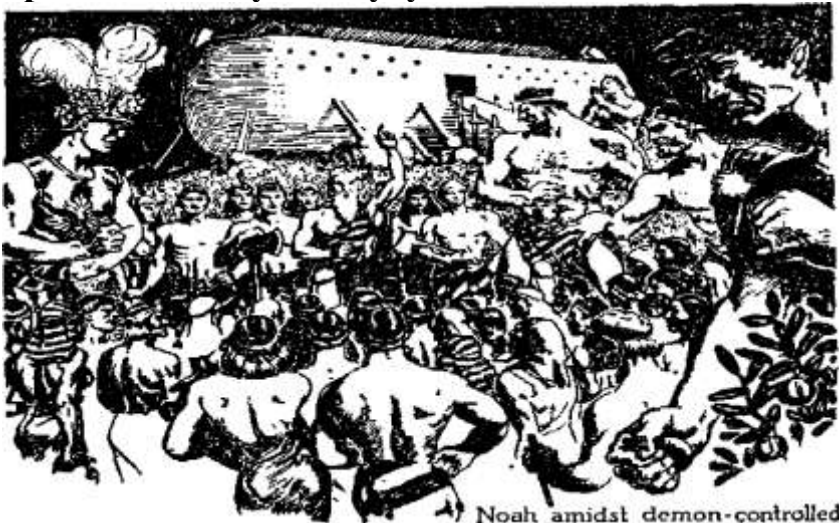
Noah amidst demon-controlled

За таке лукавство й насильство Бог післав потопні води або великий потоп, у котрім все людство окрім Ноя і його близької родини було знищене (1 Мойс. голова 6 і 7). Слова Ісусові, наведені в повисшому тексті (Мат. 24: 37), разом із фізичними фактами добре знаними доказують, що якраз такі обставини існують тепер на землі й що такі обставини стануть дуже виразними зараз перед битвою великого дня Бога Вседержителя, у котрій то битві лукаві будуть знищені.