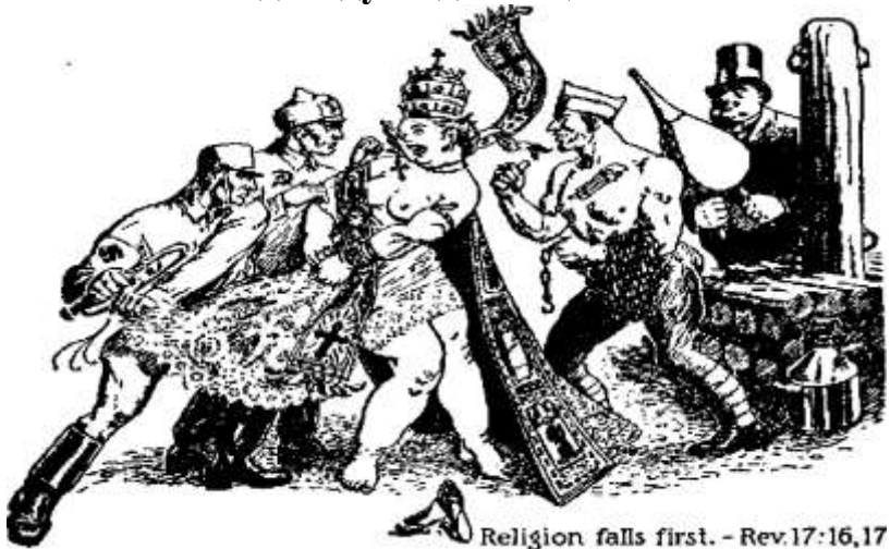
Religion falls first. - Rev.17:16,17

Край Саба знаходився далеко на південь від Єрусалиму (Мат.12:42). Пророцтво каже: “Вони продаватимуть їх . . . народові далекому”. Отже, релігійні провідники будуть забрані геть далеко від країни в якій вони торгували і практикували релігію й вже не повернуть до неї. Їх організація буде покрушена й знищена, як це святі Писання заявляють, бо володарі, цебто, радикальний елемент запалить її огнем, і Господь дасть їм таку думку це зробити (Одкр. 17:16–18). Дальше каже пророцтво Йоїла: “Ось як сказав Господь. Отже це напевно станеться, бо Господь Бог сказав це: “Я бо сказав – і доведу се до кінця”– Іса. 46:11.