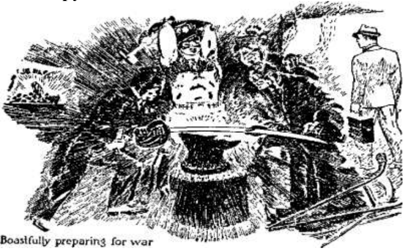
Boastfully preparing for war

хапаються всякого средства, щоб доконати мильного наміру.