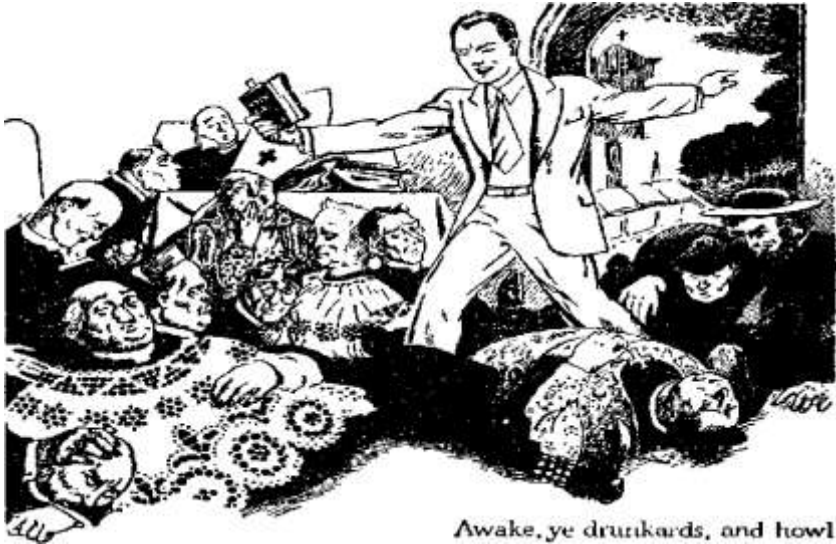
Awake, ye drunkeards, and howl

нещастя приближається на них. Вони чули вість протягом роботи церкви “періода Ілії” перед 1918 роком н.е. і зневажили нею, і тепер, коли Армагеддон є дуже близько, вони дістають сильне потрясення.