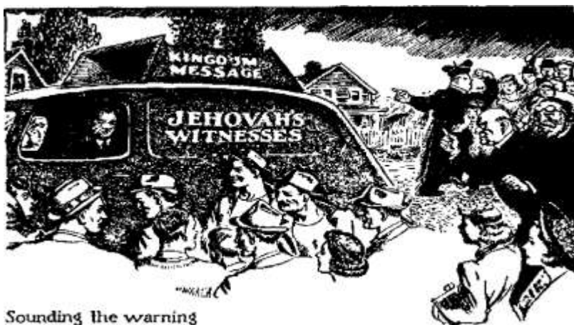
Sounding the warning

День Єгови почався в 1914 році, коли Він висшив свого царя на царський престол, тому це тепер вже близько і досягне свого вершка в час битви великого дня Бога Вседержителя. Тепер ви конується Його “дивовижна робота”, щоб повідомити всіх про Його замір, щоби не було ніякого сумніву що це робота Єгови. Коли Його “дивовижна робота” буде завершена після цього негайно наступить Його “дивовижний акт”.