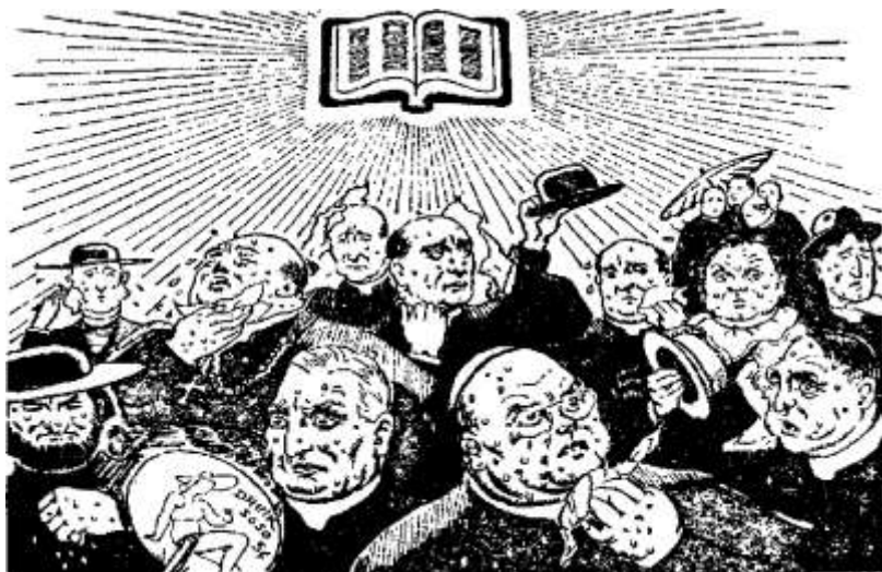
Hot day for religionists

мовляються слухати. Ті, хто є доброї волі і хто держить свої очі відкриті на правду є показані про-