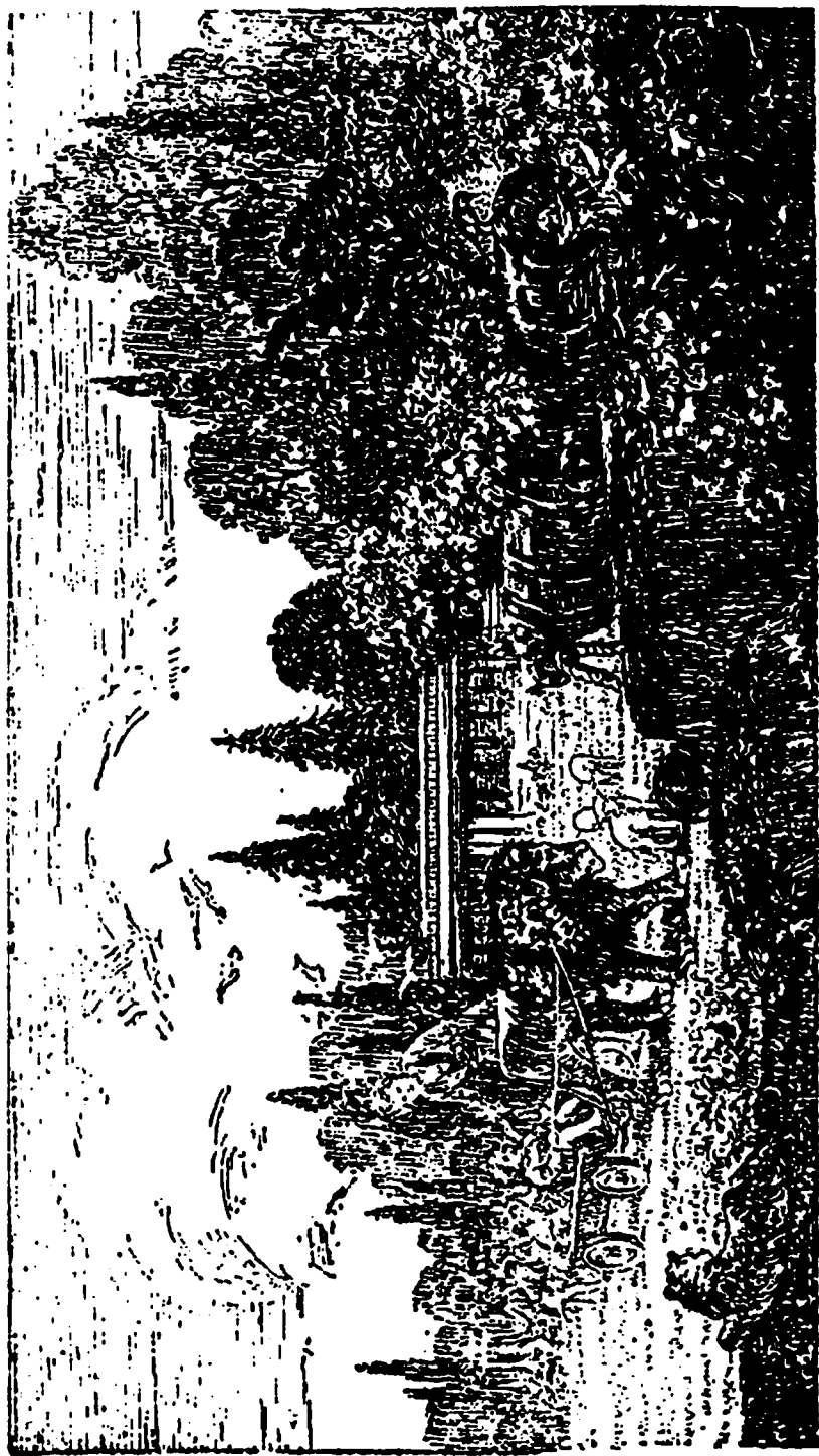
УНАСЛѢДОВАНИЕ БОГАТСТВЪ ЦАРСТВА. СТРАНИЦА 395.