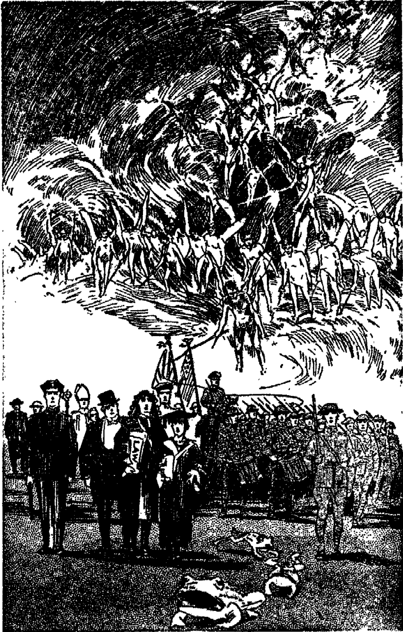
Гог в земле Магог