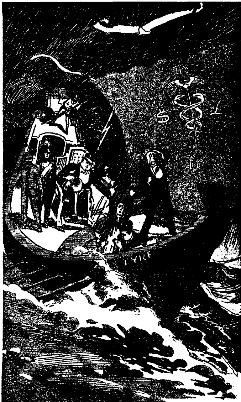
Гребцы твои завели тебя в большие воды