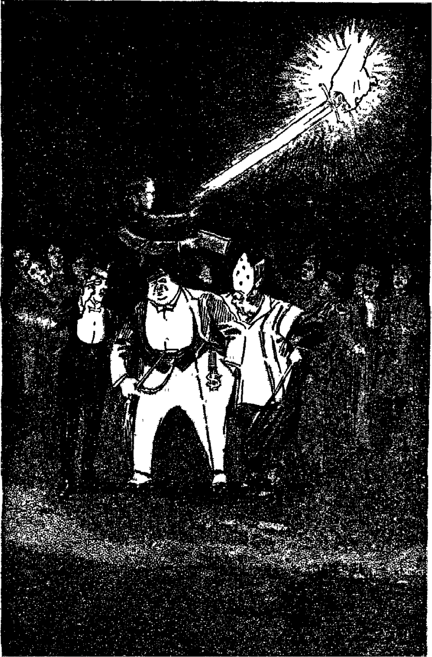
Страж дома Израиля