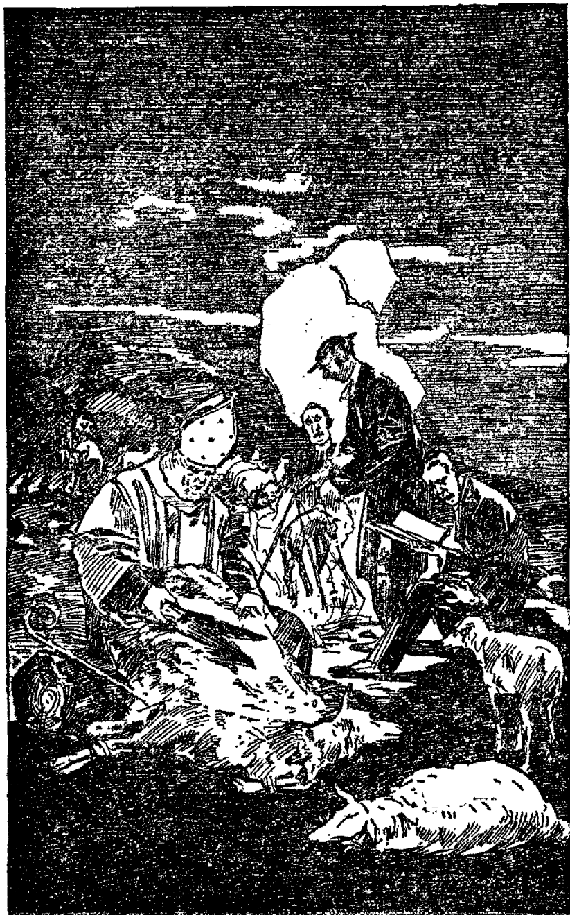
Вы ели и волною одевались