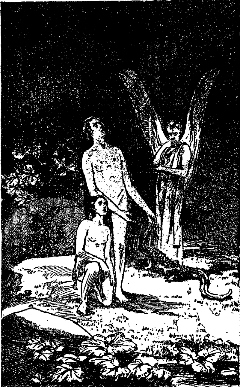
Помазанный хервум – начало коммерческого зла