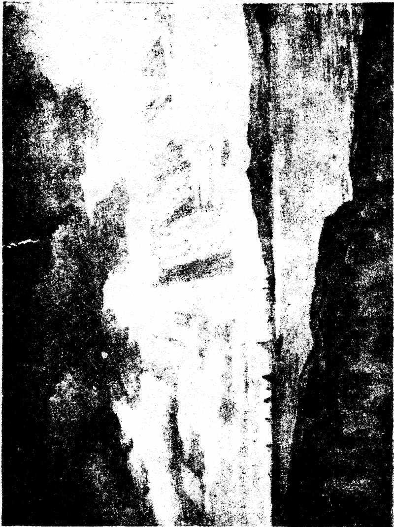
Вид — Прибережье Ирландіи.

Бог сотворил землю для человеков. (Исаия 45:12, 18) Он поместил владетельство в землю и вокруг земли для блага и общей пользы людей. Сила, заключающаяся в волнах морских, принадлежит Господу, ибо "Господня — земля и что наполняет ее" (Псалт. 23:1) Всѣ избрѣненія доущены Господом Богом для общаго благополучія всѣх людей. — Дан. 12:1. — Стр. 326.