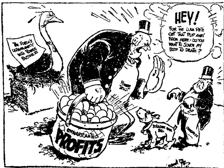
Нью-Йорк "Американ" 24-го Апрѣля, 1928 г.

нователи этого правительства торжественно заявили, что всякій человек обладает неотъемлемыми правами на жизнь, свободу и счастье. Однако же этот идеал никогда не был осуществлен на благо народа. Правда и то, что эти основатели говорили, что всякая правомѣрная власть правительства основывается на согласіи народа, однако же в настоящее время уже никто не спрашивает об этом согласіи народа и согласіе это не дано. Нѣсколько лѣтъ послѣ основанія Штатов была сдѣлана попытка осу-