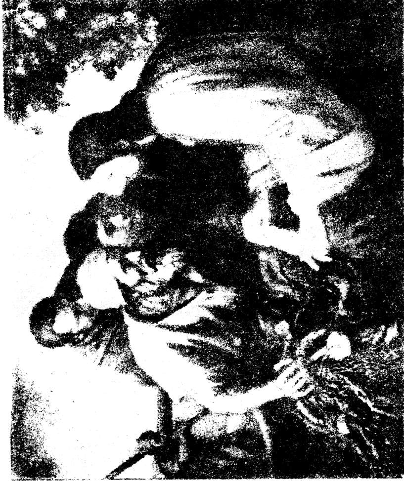
Иисус и Оубак.