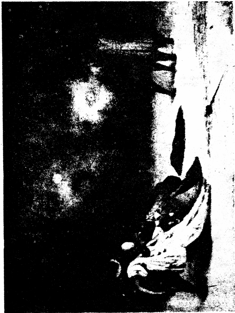
Лая Леон Лжеполе

Если два частных лица взаимно обмѣняются письмами в попыткѣ утѣренія своих недоразумѣній, и затѣм оба согласны встрѣтиться на полюдь ... со смертоносным орудіем, и один из них будет убит, тогда оставшіяся в живых отвѣтствен за убійство в первой степени ... Когда же нѣсколько единиц имѣющих дѣло по отношенію их правительствъ рѣшат устранить свои недоразумѣнія смертоносным орудіем по полѣ битвы, то это называется "война". — Страница 315.