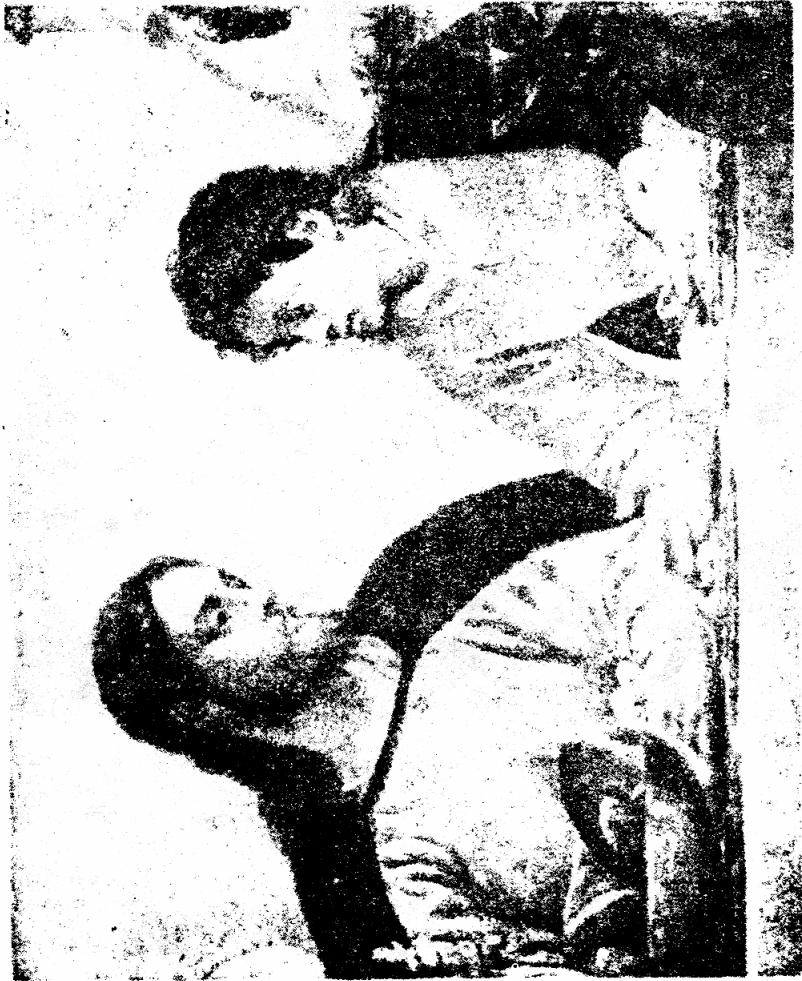
Христос и Иоанн.