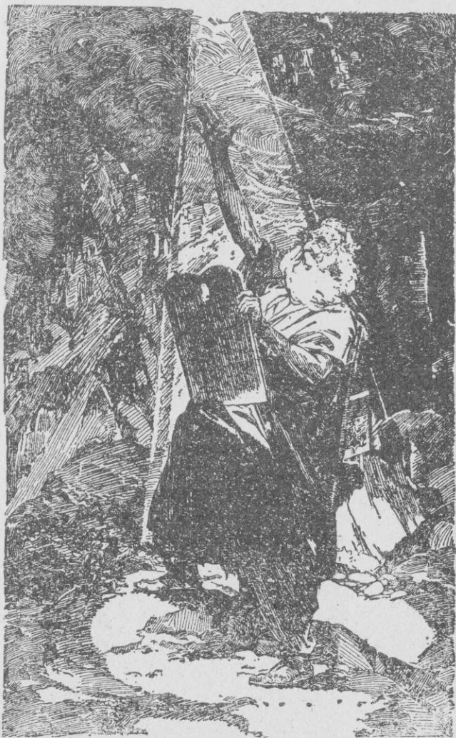
Моисей принимает закон у горы Синая.