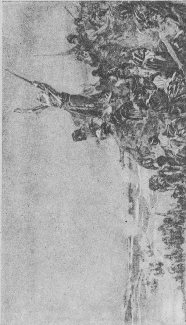
Избавленіе Израіля при Красном морѣ

Предзнаменованіе близкой погибели члзовѣческих угнетателей.